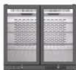
ERV 25 SH

600 x 510 x 850 mm. Temp. +4°C/+8°C C. Clima. 4 / 38°C 230V/1ph/50Hz