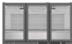
ERV 35 SH

900 x 510 x 850 mm. Temp. +4°C/+8°C C. Clima. 4 / 38°C 230V/1ph/50Hz