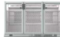
ERV 35 II SH

900 x 510 x 850 mm. Temp. +4°C/+8°C C. Clima. 4 / 38°C 230V/1ph/50Hz