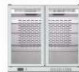
ERV 25 II SH

600 x 510 x 850 mm. Temp. +4°C/+8°C C. Clima. 4 / 38°C 230V/1ph/50Hz